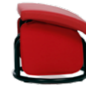
Schwing-Hocker Art.-Nr. 63910