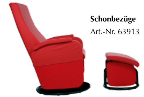
Schonbezüge Art.-Nr. 63913