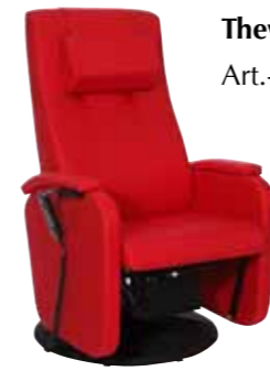
ThevoMulti - Aktiv-Sessel Art.-Nr. 63920

ThevoMulti - Info-Telefon 0 47 61 / 886 77